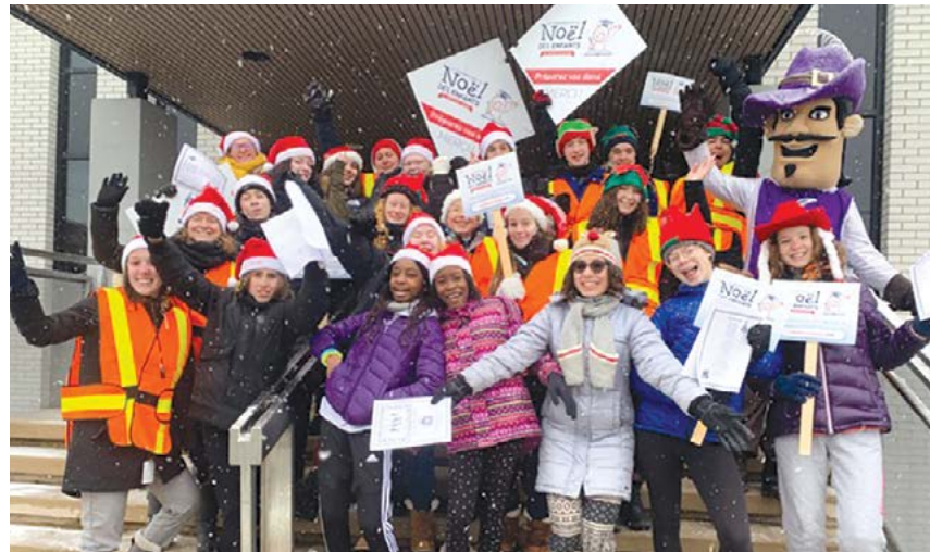
Noël des Enfants 2019